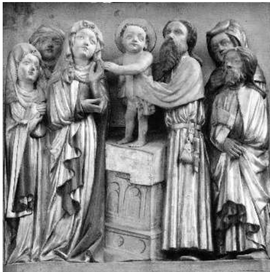
Darstellung des Herrn, Barfüßerkirche, Erfurt