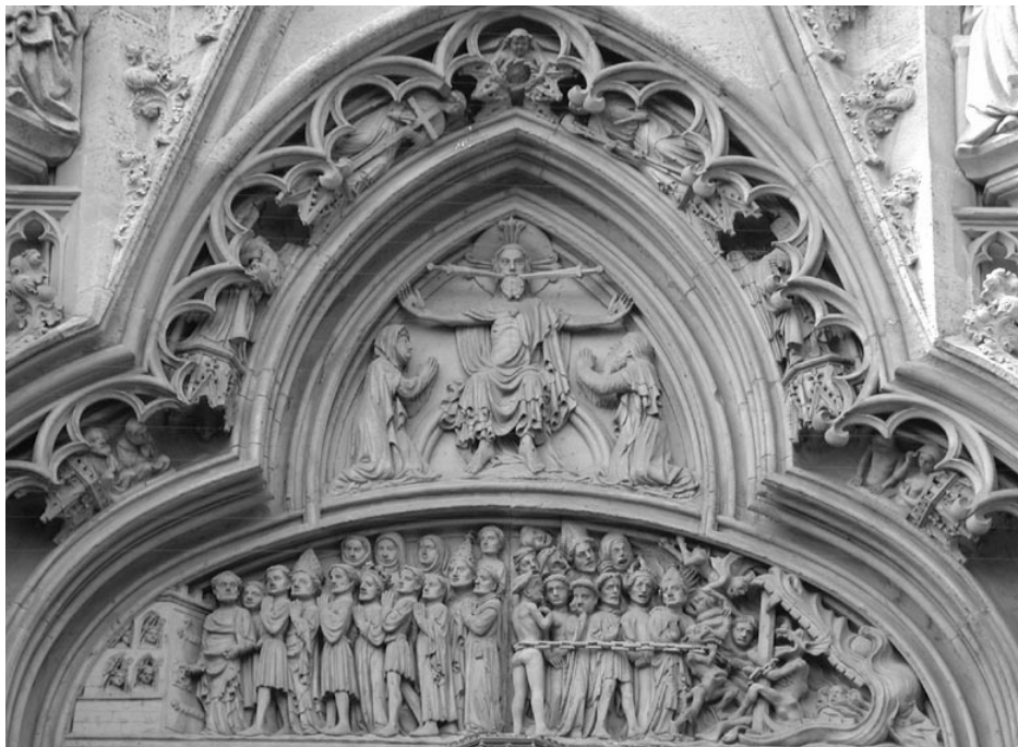
Weltgerichtsportal der Frauenkirche Esslingen

„Was ihr einem meiner geringsten Geschwister getan habt, das habt ihr mir getan“